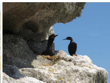
Grand gravelot, Mickaël Buanic / Agence française pour la biodiversité Oseille des rochers - Cormoran huppé : Hélène Mahéo / Agence française pour la biodiversité