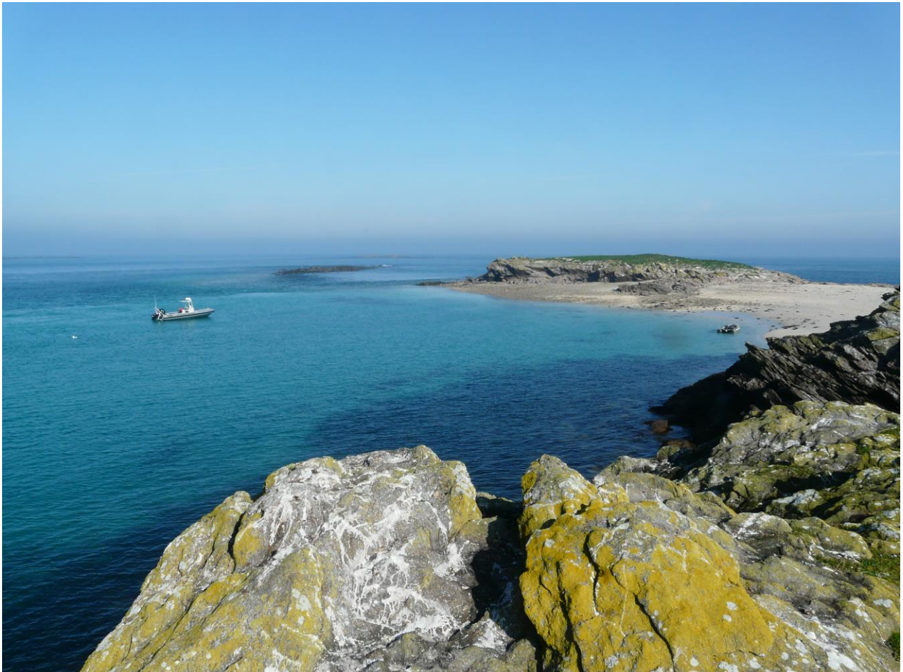
Vue depuis l'île de Litiri dans l'archipel de Molène